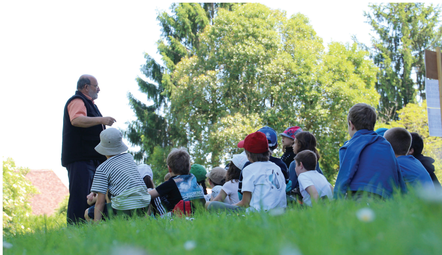
Animation de Culture Y Nature