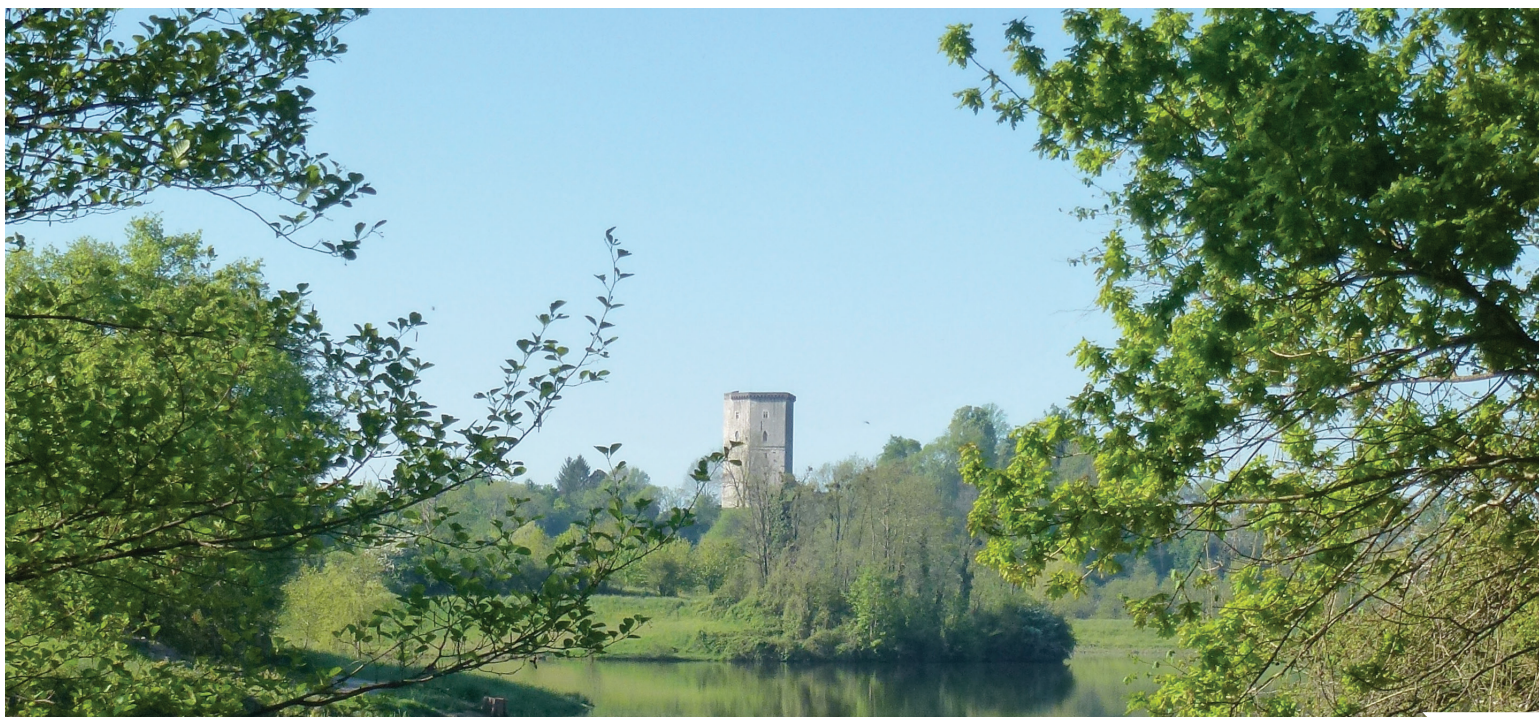
Le lac du Grecq

Panneau d'identification installé par l'association Orthez Biodiversité