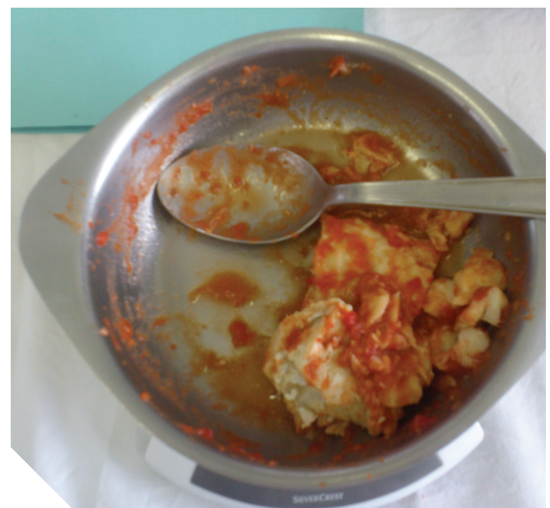
Mesure d'un reste de plat en fin de repas

Certains plats sont souvent jetés entre 20 et 40 % (pouvant aller parfois jusqu'à 60 %).