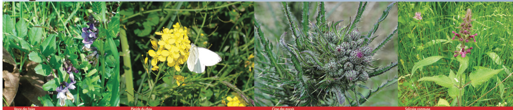
Vanox des haies